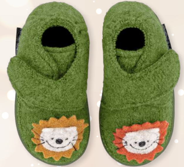
LION KING 2.0 31-0472, Gr. 18-26 90 Grün