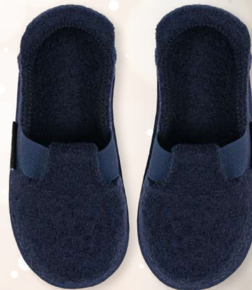
MOUNTAIN 2.0 31-0337, Gr. 23-42 32 Dunkelblau