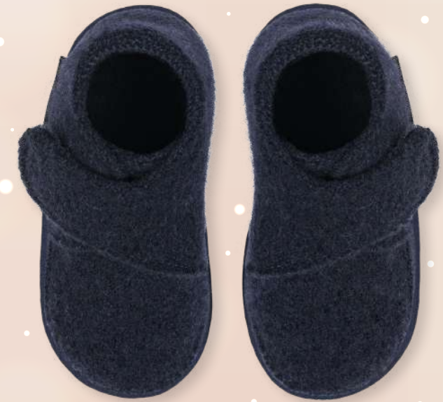
LEILA 2.0 31-0116, Gr. 18-26 32 Dunkelblau