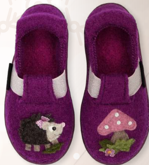
PRICKY HEDGEHOG 2.0 31-0423, Gr. 23-35 43 Bordeaux