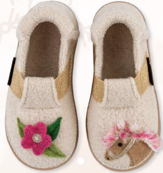
LITTLE HORSE 2.0 31-0480, Gr. 23-36 12 Beige Melé