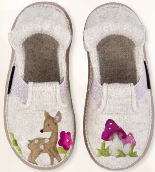
BAMBIS 2.0 31-0484, Gr. 23-35 10 Weiß