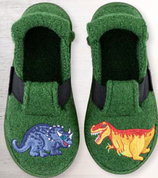
DINOS 2.0 31-0485, Gr. 23-36 98 Dunkelgrün