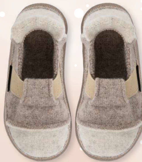
BERG 2.0 31-0010, Gr. 23-38 83 Natur