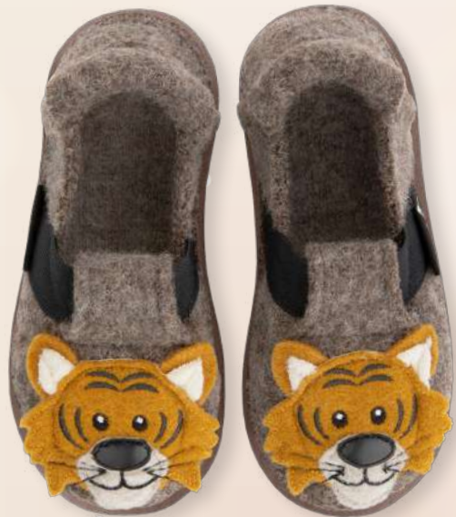
ROAR TIGER 2.0 31-0442, Gr. 23-35 80 Braun