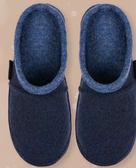
GIPFEL 2.0 31-0020, Gr. 36-46 38 Marine