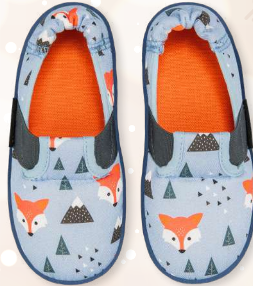
FÜXLEIN 2.0 30-0566, Gr. 23-38 34 Hellblau