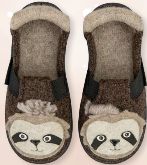
SHAGGY SLOTH 2.0 31-0425, Gr. 23-35 80 Braun