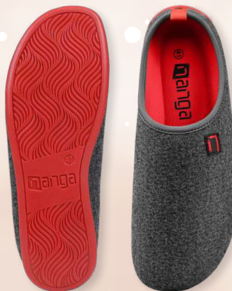
WOOL SLIPPER 26-0504, Gr. 36-46 20 Rot