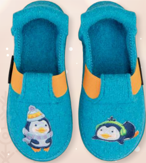
FUNNY PINGU 2.0 31-0546, Gr. 23-35 37 Türkis