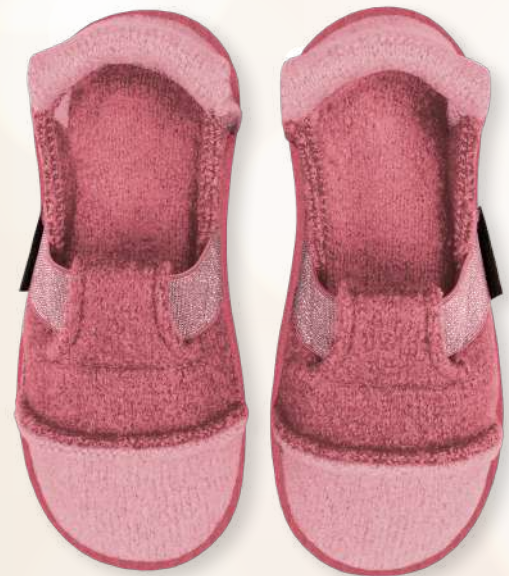
BERG 2.0 31-0010, Gr. 23-38 29 Azalee