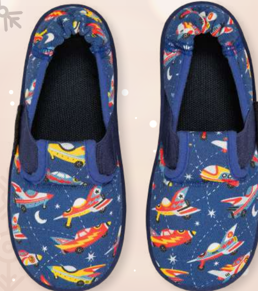
AERO 2.0 30-0520, Gr. 23-35 30 Blau