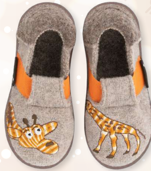
LAZY GIRAF 2.0 31-0443, Gr. 23-35 83 Natur