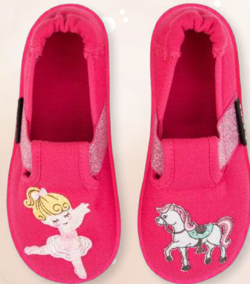
ZIRKUS 2.0 30-0530, Gr. 23-35 27 Himbeer