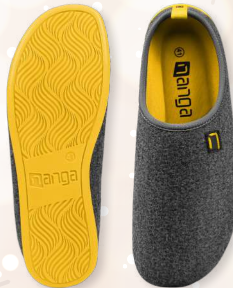
WOOL SLIPPER 26-0504, Gr. 36-46 74 Gelb