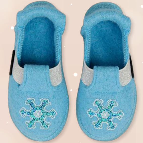
SNOWFLAKE 2.0 31-0545, Gr. 23-35 33 Türkis