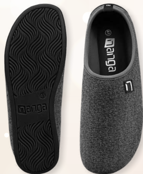
WOOL SLIPPER 26-0504, Gr. 36-48 50 Schwarz