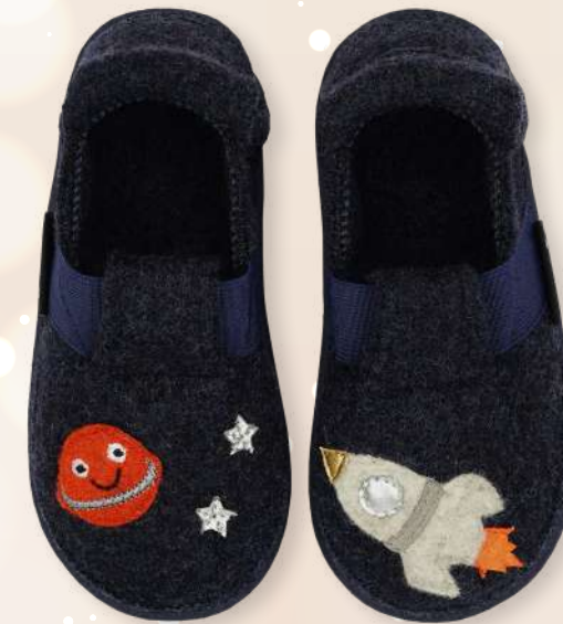
ROCKET BOY 2.0 31-0430, Gr. 23-35 13 Blau