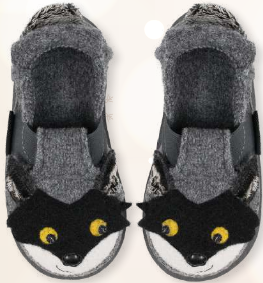
RACCOON 2.0 31-0304, Gr. 23-36 65 Grau