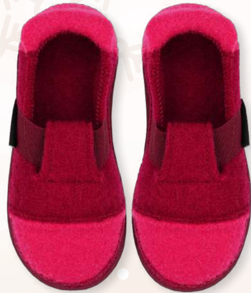
BERG 2.0 31-0010, Gr. 23-38 44 Flieder