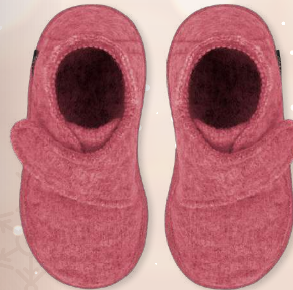
LEILA 2.0 31-0116, Gr. 18-26 29 Azalee