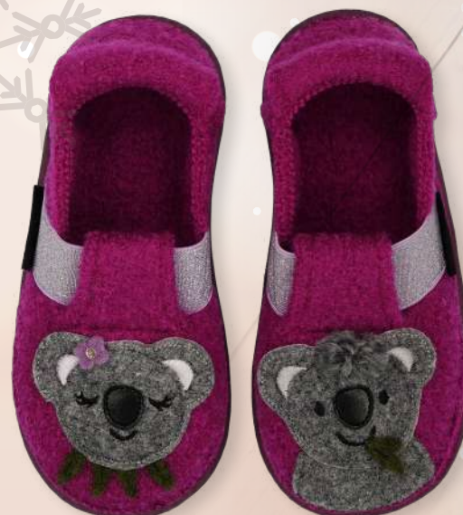
KOALA BABYS 2.0 31-0421, Gr. 23-35 24 Beere