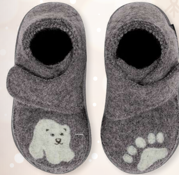
LITTLE POLAR BEAR 2.0 31-0416, Gr. 18-26 64 Mittelgrau