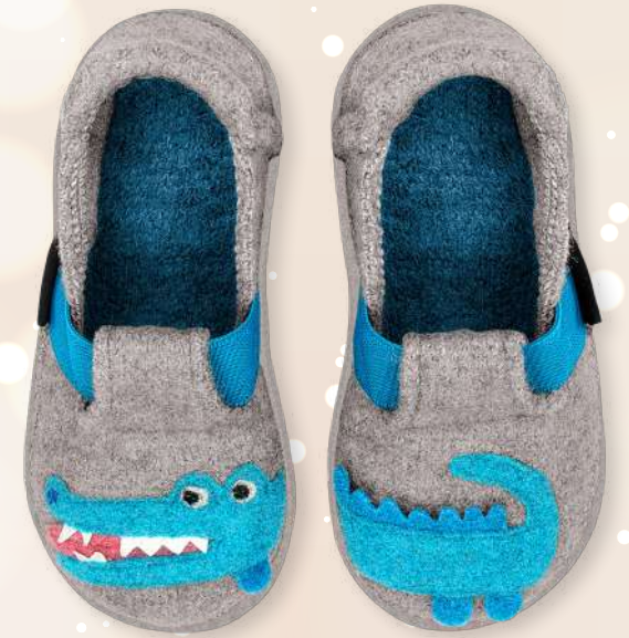
FUNNY CROCO 2.0 31-0392, Gr. 23-36 66 Hellgrau