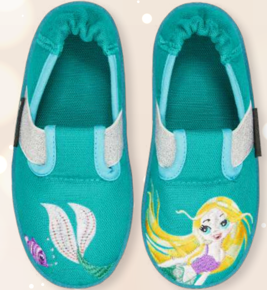
KLEINE MEERJUNGFRAU 2.0 30-0497, Gr. 23-35 33 Türkis