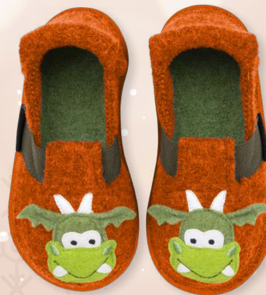
MAGIC DRAGON 2.0 31-0515, Gr. 23-36 72 Safran