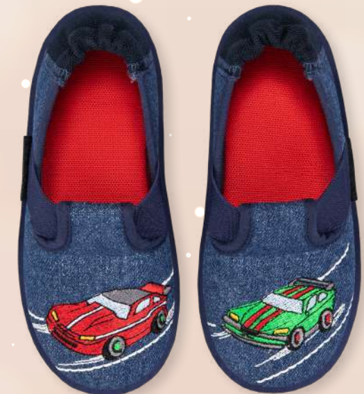
DAYTONA 2.0 30-0498, Gr. 23-38 30 Blau