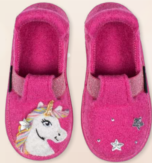
UNICORN 2.0 31-0344, Gr. 23-35 27 Pink