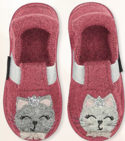
ARISTOKITTY 2.0 31-0422, Gr. 23-35 29 Azalee