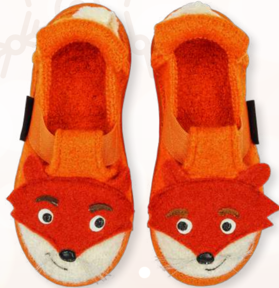
FOX 2.0 31-0298, Gr. 23-36 70 Orange