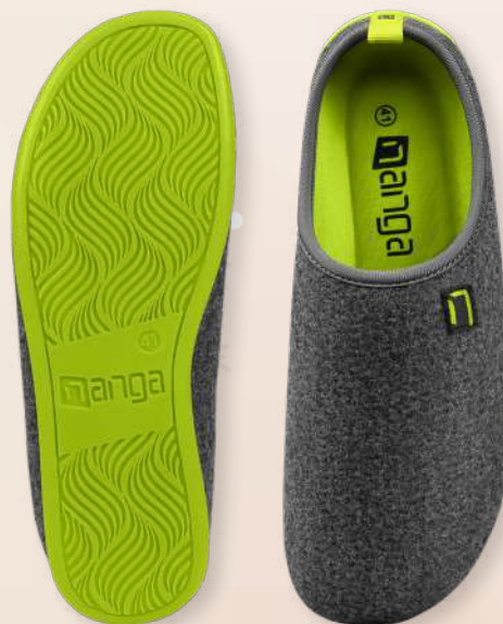
WOOL SLIPPER 26-0504, Gr. 36-46 90 Grün