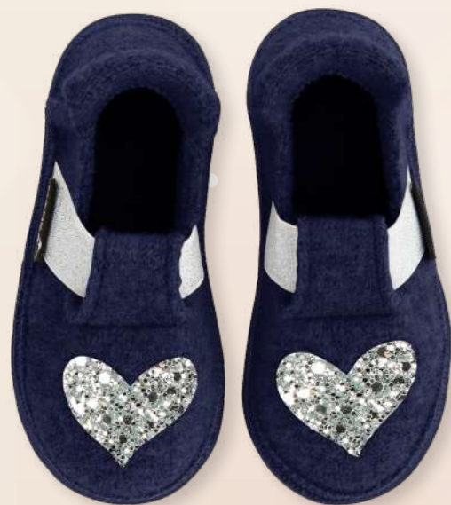
I HEART U 2.0 31-0439, Gr. 23-38 32 Dunkelblau