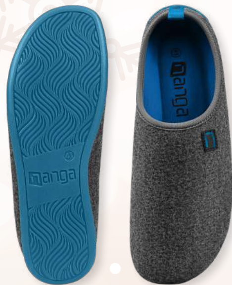
WOOL SLIPPER 26-0504, Gr. 36-46 30 Blau