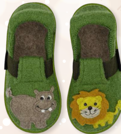
JUNGLE KINGS 2.0 31-0426, Gr. 23-35 90 Hellgrün