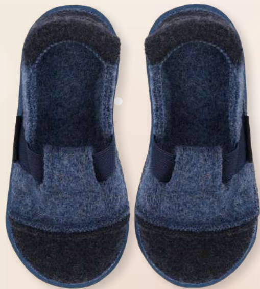
BERG 2.0 31-0010, Gr. 23-46 31 Blau