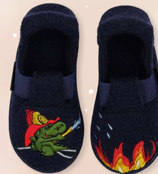
LITTLE FIREMAN 2.0 31-0427, Gr. 23-35 32 Dunkelblau